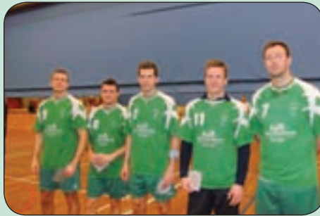
Nr. 3 Slagelse