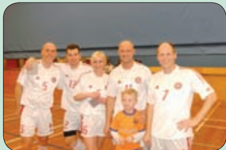
Nr. 2 OB Kbh. uddannelse